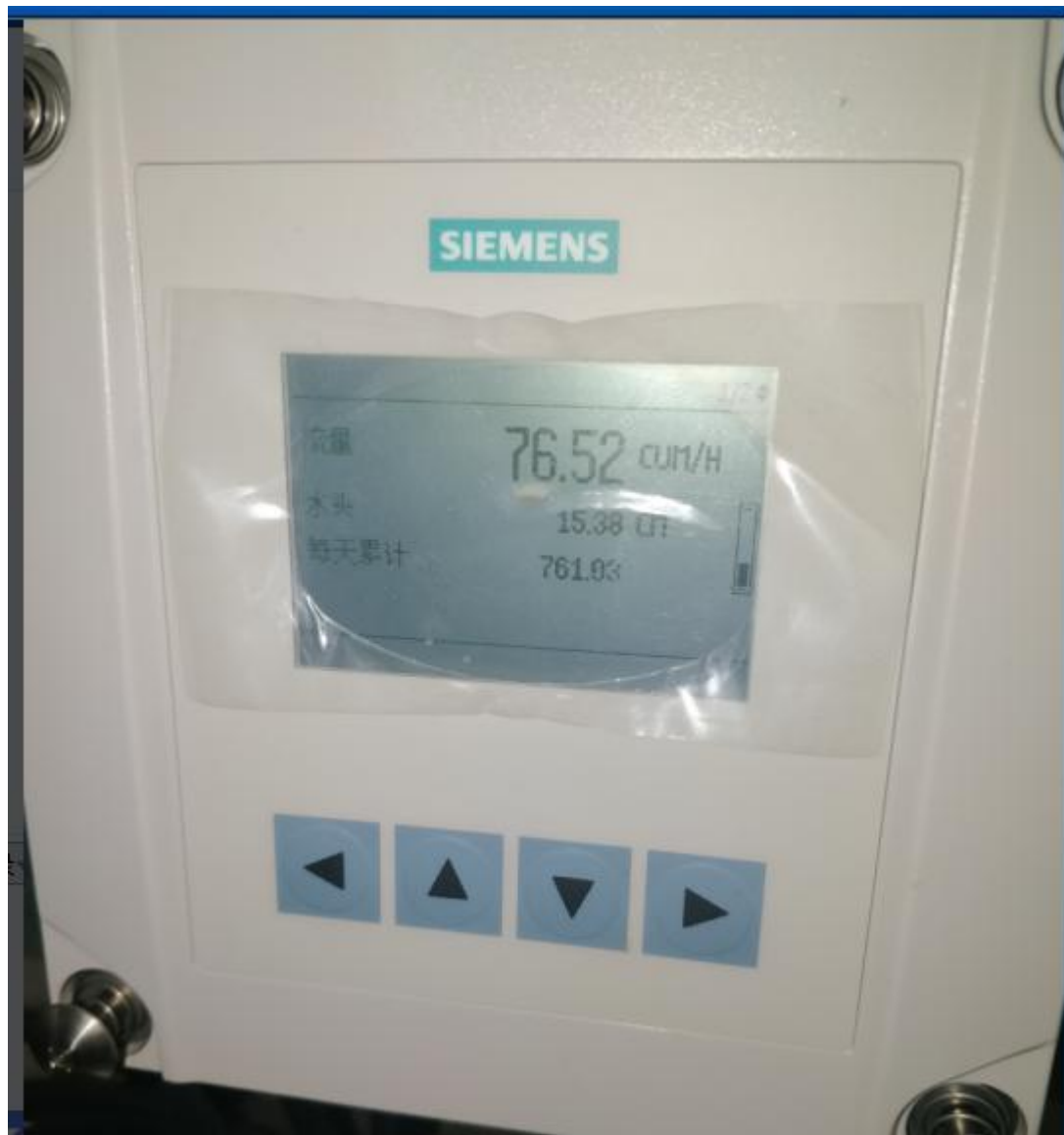
1. 西门子明渠流量计正面